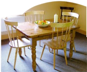
Iaulau ma nofoa

O Vailaau ua fa'aaogaina mo le tapêina o siama. Fa'amo-lemole, e fautuaina lava le tu mama, ma fa'amama nei nofoaga i taimi uma e pei ona ta'ua: