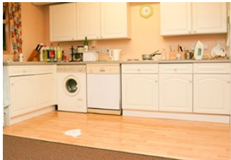
totonu o umukuka