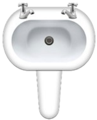
paipa i totonu o faletaele (sink)